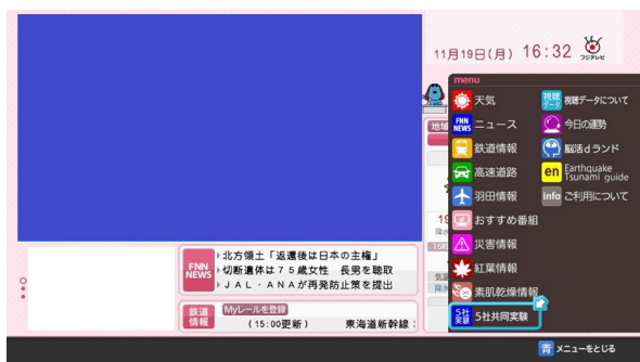
【データ放送 TOP 画面】(※)